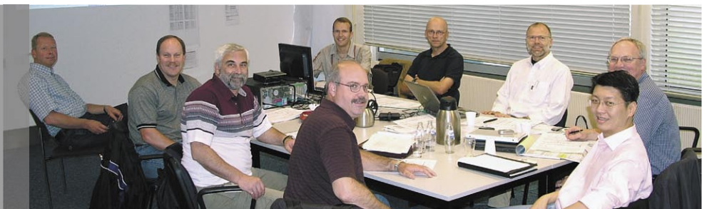
Projektgruppe bei der letzten Besprechung bei Tevopharm

Da die Maschine nur aus wenigen Bauteilen besteht, zeichnet sie sich durch hohe Produktionssicherheit und -zuverlässigkeit sowie durch vereinfachte Wartungs-, Reinigungs- und Umrüstarbeiten aus. Für die Verarbeitung von sehr anspruchsvollen Produkten wie Gefrier- und Kühlgut ist eine Edelstahlausführung erhältlich.